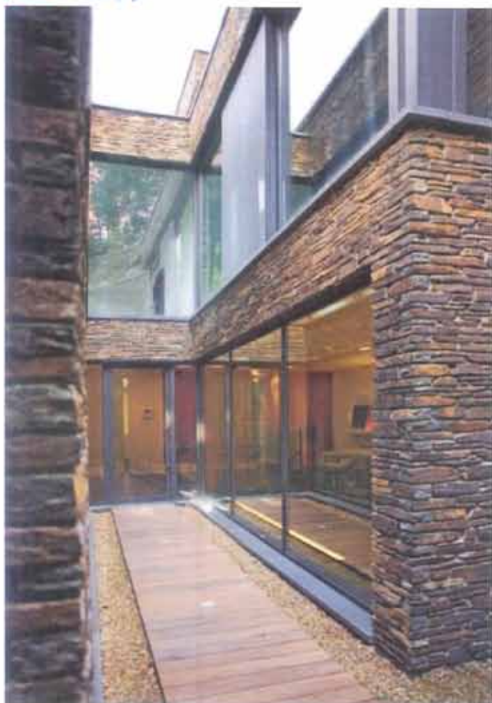
Om de kamers die tegen de rots gebouwd zijn toch te voorzien van licht, voorzag de architect in een inham met grote glaspartijen. Zo ontstond meteen een tweede toegang tot het huis.