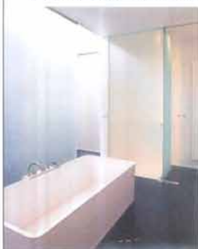
De badkamer oogt bijzonder strak en is bijna volledig in witte corian en glas uitgevoerd.