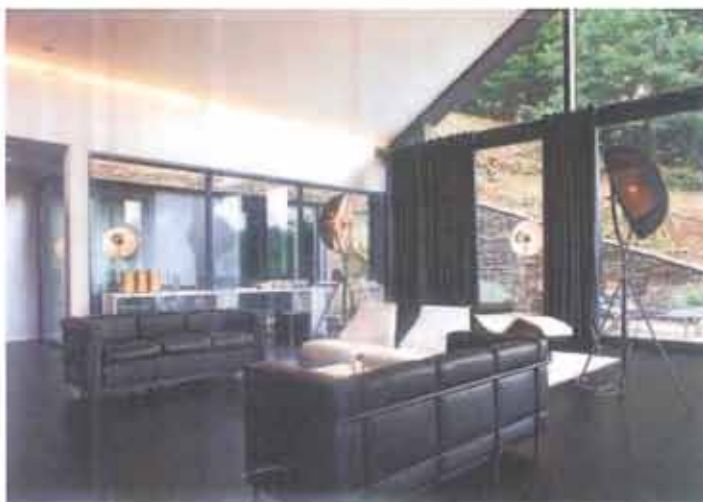
Zwart en wit zetten de toon in dit interieur. De verlichting bestaat uit studio lampen en neonlijnen die langs het plafond zijn aangebracht.