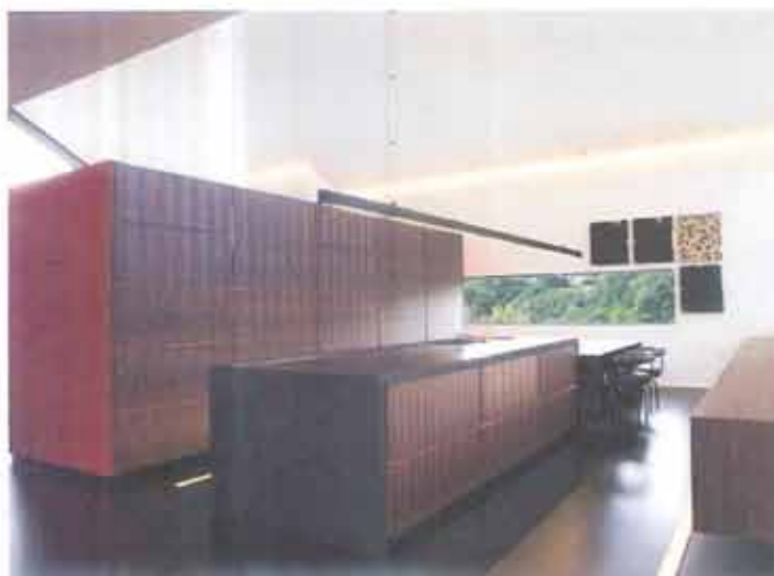
Twee parallelle volumes in macassarhout vormen de open keuken. Het kookveld loopt mooi over in de eettafel. Om de eenheid te bewaren is de buffetkast (rechts) in hetzelfde materiaal uitgevoerd.