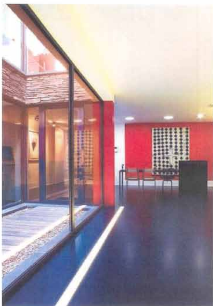
De gietvloer werd al snel vervangen door geweven vinyl van Bolon. «Het effect is gelijkwaardig, maar je krijgt geen krassen en schauren».