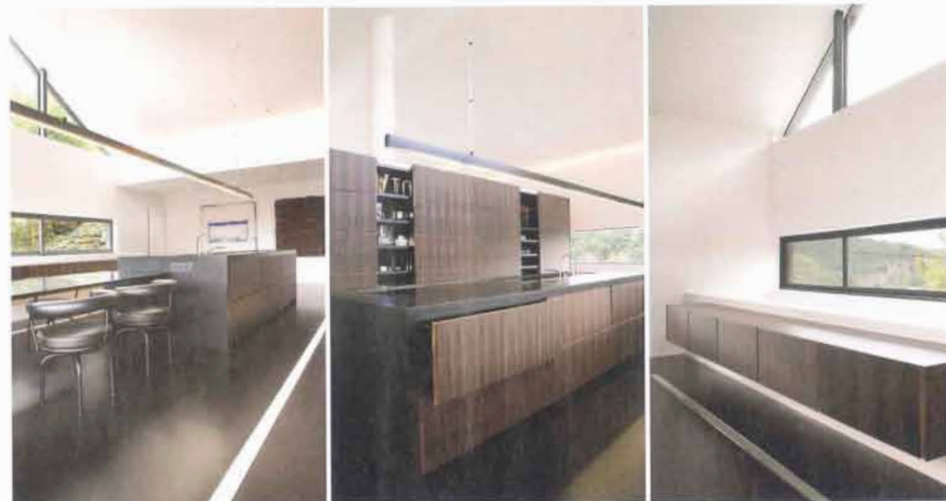
De kasten in de keuken zijn van macassarhout, de werkbladen van zwart Corian. De zelf ontworpen pendellamp benadrukt de lengte van het eiland en de ruimte, net als de lichtlijnen in de vloer.