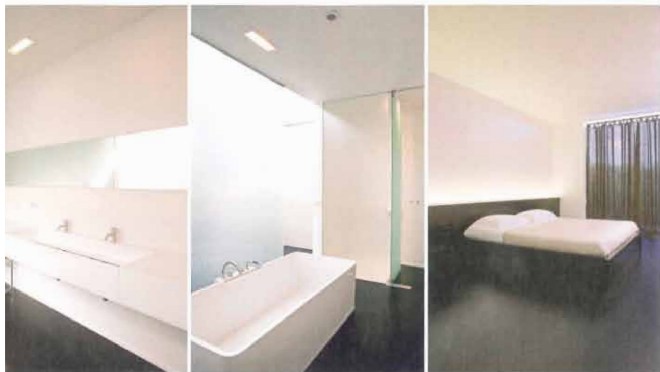
Idee: in de badkamer koos de heer des huizes voor een bad van Aquamass, kranen van Vola en een zelf ontworpen wastafel. De wastafel en de bekleding van de uit wit Corian vervaardigd. De gezuurde glazen plaat voor het ligbad zorgt voor extra intimiteit in de open badkamer, maar laat tegelijkertijd veel daglicht binnen.

'Het huis heeft grote glaspartijen, en daardoor spelen de verschillende seizoenen en het prachtige uitzicht over het dal een hoofdrol, het hele jaar lang'