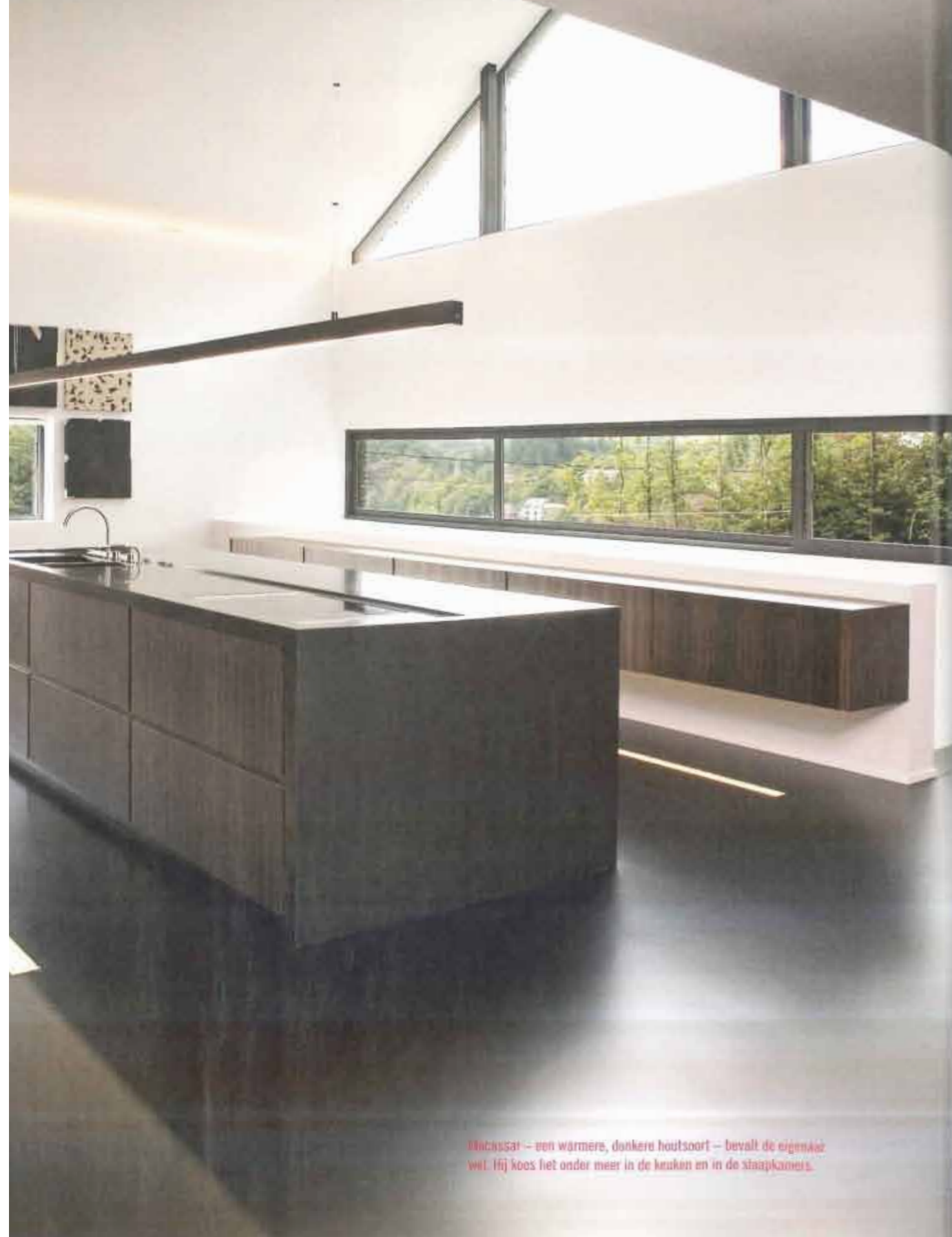
Macassar – een warmere, donkere houtsoort – bevalt de eigenaar wel. Hij koos het onder meer in de keukens en in de slaapkamers.