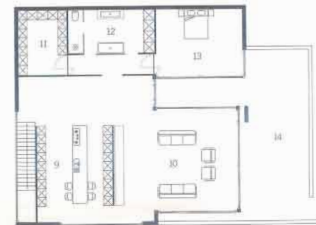
1 ste verdieping